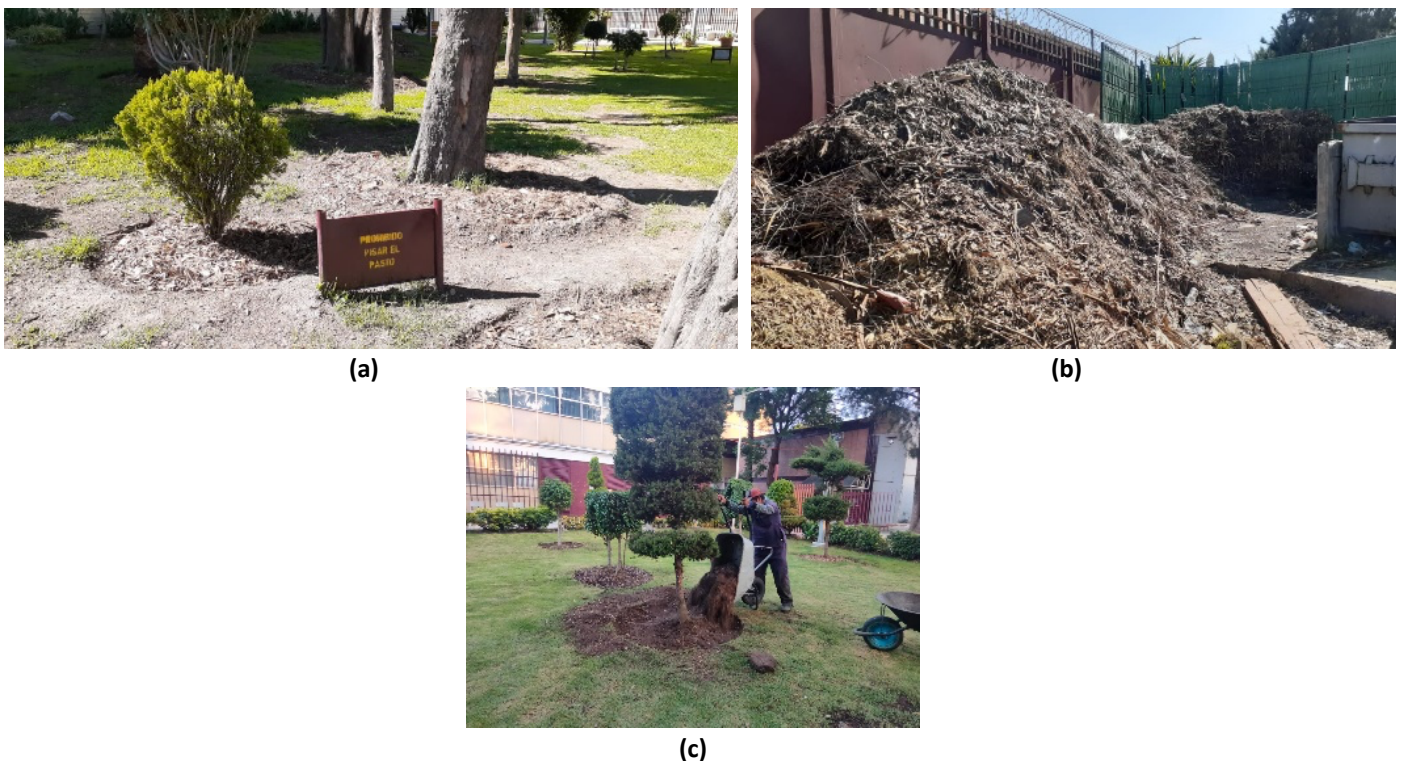
Figura 2. Se muestra (a) los cajetes realizados a los árboles, (b) la separación de la hojarasca y (c) la reutilización en composta.