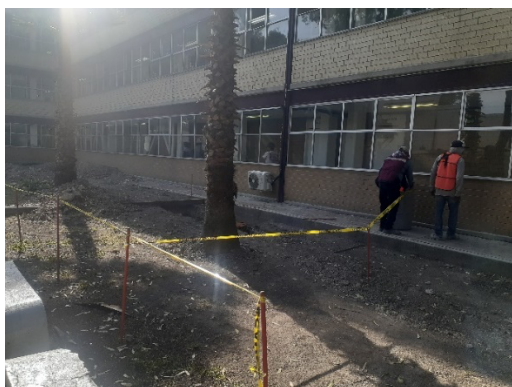
Figura 3. Áreas más afectadas

Se establecen las áreas de intervención y se realizan calendarios para poder realizar los trabajos de conservación encintando las áreas para evitar el paso.