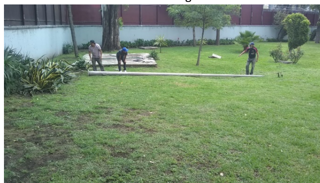
Figura 6. Retiro de elementos dentro de las áreas verdes

Se evalúan los periodos del año con una mínima precipitación y se define en que mes es factible el riego de manera controlada para colocar un sistema mecanizado y automatizado con el fin de no desperdiciar agua más allá de la necesaria.