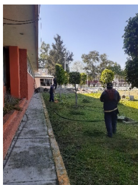
Figura 5. Seguimiento de colocación de composta