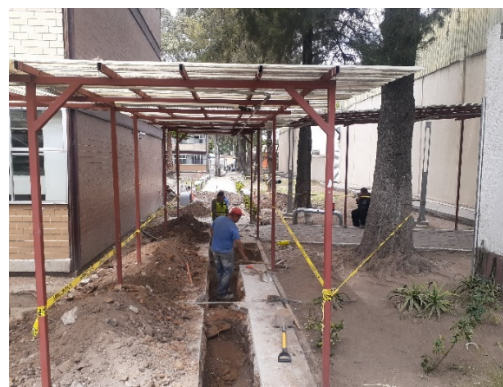
Figura 4. Se encintaron las áreas a mejorar y se registran