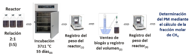
Figura 1. Método gravimétrico para el análisis del potencial metanogénico.

Resultados. La caracterización de los sustratos empleados como dietas para las MSN y para el proceso de DA, arrojó valores de ST, SV, lípidos y proteínas en un rango de 25.17 - 36.52%, 77.01 - 96.36%, 0.06 - 0.91% y 1.49 - 13.68%, respectivamente. Mientras que las larvas presentaron valores de lípidos de 9.63 - 30.8% y proteínas de 17.76 - 37.23%, similares a lo reportado en trabajos previos (Dortmans et al., 2017). Referente a los SV de los sustratos, estos indican la alta cantidad de materia orgánica (MO), que es utilizada