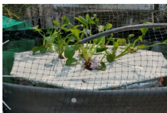
Figura 1. Isla Flotante Artificial con Eichhornia crassipes

Materiales y Métodos. Eichhornia crassipes fue extraída de cuerpos de agua en la región de Tezonapa, Veracruz, México. El periodo de aclimatación de las plantas fue de 7 días. Las aguas residuales se extrajeron de una lavandería doméstica, las cuales se dispusieron en contenedores de polietileno con una capacidad de 20 litros. Las Islas Flotante Artificial (Figura 1) se dispusieron en cada contenedor, por lo cual se establecieron dos sistemas de tratamiento en modo discontinuo, teniendo un tiempo de retención hidráulico de 21 días.