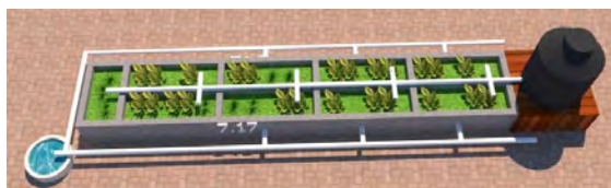
Figura 2. Distribución del humedal construido horizontal de flujo subsuperficial.

El agua residual usada para efectuar el tratamiento se limitó únicamente a agua residual doméstica que fue caracterizada mediante la norma NORMA OFICIAL MEXICANA NOM-001-SEMARNAT-1996, esta agua fue tratada mediante un humedal construido de flujo horizontal subsuperficial, eficaz en la remoción de contaminantes que a través de sus componentes permiten una eliminación parcial de nutrientes (Sandoval et al., 2020) la distribución del humedal se muestra en la figura 2.