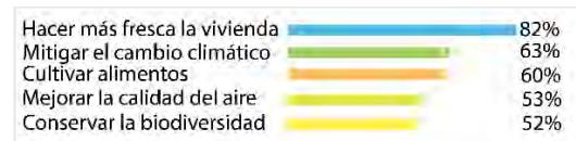
Figura 4. Razones para instalar un techo verde

Las cinco razones más votadas para instalar un techo verde en la vivienda (Figura 4) se relacionan con servicios ecosistémicos de regulación y provisionamiento, dejando en sexto lugar servicios culturales como belleza escénica. Esto es consistente con el 80% de encuestadas que afirmó que probablemente instalaría un techo verde en su vivienda con especies nativas, aunque este careciera de belleza estética. Asimismo, para dos tercios de las personas encuestadas es importante que las especies utilizadas en la instalación de techos verdes sean nativas.