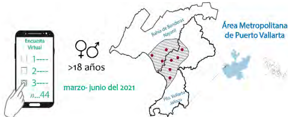
Figura 1. Metodología

Materiales y Métodos. Se realizó una encuesta no representativa en el Área Metropolitana de Puerto Vallarta -AMPV- (Figura 1). La encuesta exploró dos temas: techos verdes y usos de la azotea. El tamaño de la muestra se estableció en un mínimo de 100 encuestados.