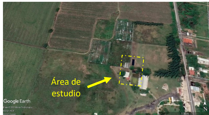
Figura 1. Lugar de establecimiento del cultivo de chile jalapeño bajo condiciones de sistema de riego fotovoltaico del trabajo de investigación:

presencia de plagas específicamente mosquita blanca y lepidópteros realizándose el control a través del ingrediente activo bifentrina a una dosis de 0.5 L/ha y presencia de hongos los cuales fueron controlados con el ingrediente activo mancozeb a una dosis de 5 g/L de agua.