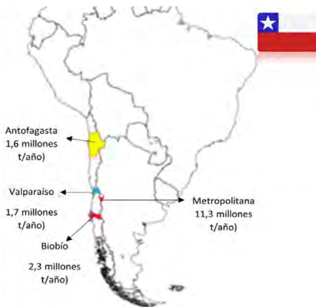
Figura 4. Regiones de Chile que generaron más residuos en el 2017 (MMA, 2019).

Chile. La República de Chile se divide en 16 regiones y éstas en provincias. Posee una superficie total de 756, 945 km 2 , siendo el octavo país con mayor territorio en AL. Según datos de 2018 del Instituto Nacional de Estadísticas (INE), su población asciende a 18,751,405 habitantes (MAEUEC, 2020b). En 2017 Chile generó cerca de 23 millones de toneladas de residuos; el 97.3% fueron no peligrosos y el 2.7% residuos peligrosos, que son los dos tipos reconocidos en ese país. Los residuos no peligrosos contemplan los de origen industrial (60.4%), los RSM aportan el 35.3% y los lodos provenientes de Plantas de Tratamiento de Aguas Servidas (PTAS-1.6%) (MMA, 2019). En ese mismo año, la región Metropolitana de Chile fue la que presentó una mayor generación de residuos con 11.3 millones de toneladas, seguida por la región de Biobío, Valparaíso y Antofagasta. La Figura 4 muestra las cuatro regiones que generaron más residuos en el 2017; incluyen los dos tipos de residuos.