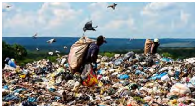
Figura 3. Vertedero “El Estructural”, ubicado en Brasil, el sexto más grande de América Latina (BBC, 2016).

En 2018 se recolectaron 72.7 millones de toneladas de RSU (199,178 t/día), de las cuales el 59.5% tuvo una disposición final adecuada y fueron enviados a vertederos sanitarios. Sin embargo, se siguen utilizando unidades inadecuadas como vertederos a cielo abierto y vertederos controlados (23% y 17.5%, respectivamente). El “Jardín Gramacho” es uno de los vertederos más grandes en AL y el tercer mayor vertedero del mundo; se encuentra ubicado en Río de Janeiro con un volumen de 45 millones de toneladas de RSU. La Figura 3 muestra otro vertedero gigante situado en Brasilia, “El Estructural” con un volumen de 21 millones de toneladas, situado como el sexto vertedero más grande de AL. Ambos cerraron, pero continúan generando impactos negativos al ambiente (Dannemann, 2019).