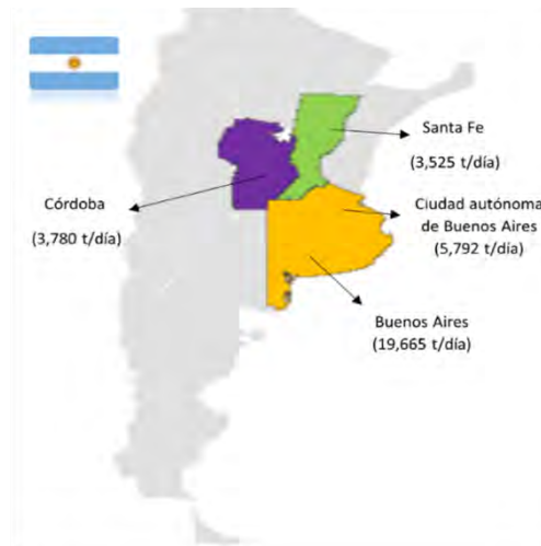
Figura 1. Provincias de Argentina que generaron más RSU en 2015 (Elaborado con información de MAYS, 2016).