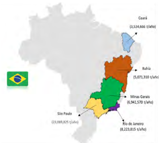
Figura 2. Estados de Brasil que generaron más RSU en 2019 (Desarrollado con datos de Abrelpe, 2020).

En 2018 se recolectaron 72.7 millones de toneladas de RSU (199,178 t/día), de las cuales el 59.5% tuvo una disposición final adecuada y fueron enviados a vertederos sanitarios. Sin embargo, se siguen utilizando unidades inadecuadas como vertederos a cielo abierto y vertederos controlados (23% y 17.5%, respectivamente). El “Jardín Gramacho” es uno de los vertederos más grandes en AL y el tercer mayor vertedero del mundo; se encuentra ubicado en Río de Janeiro con un volumen de 45 millones de toneladas de RSU. La Figura 3 muestra otro vertedero gigante situado en Brasilia, “El Estructural” con un volumen de 21 millones de toneladas, situado como el sexto vertedero más grande de AL. Ambos cerraron, pero continúan generando impactos negativos al ambiente (Dannemann, 2019).