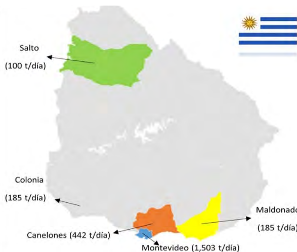
Figura 7. Departamentos de Uruguay que generan más residuos (Desarrollado con datos de Sadres, 2018).