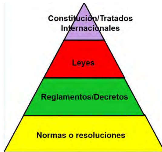
Figura 8. Jerarquización de la legislación

estado de las vías de comunicación, principalmente. El conjunto de los factores mencionados determina el aumento o la disminución en el porcentaje de cobertura nacional.