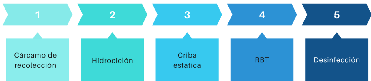
Figura 1. Diagrama de bloques del proceso.

Como se muestra en el diagrama de bloques de la Figura 1